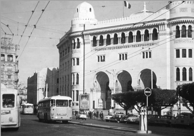
Grande Poste d'Alger